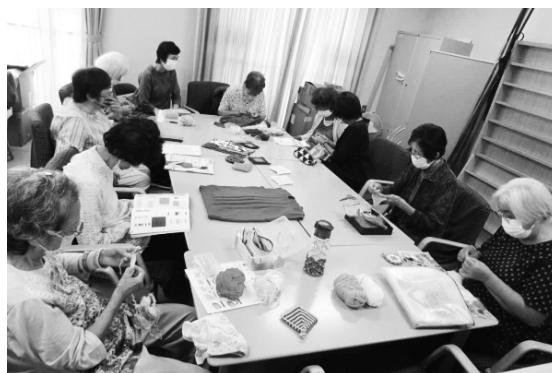
あみものグループ