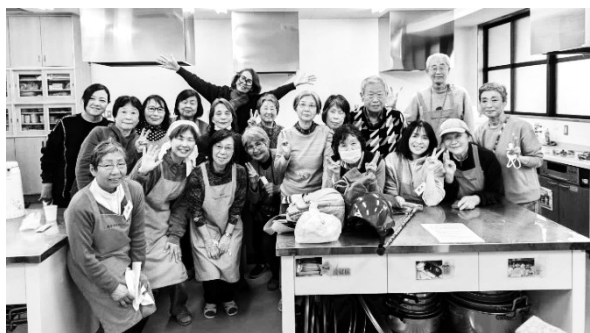
南越谷地域交流グループ